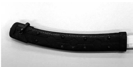
図1-2. 柄2(金属装)の外観