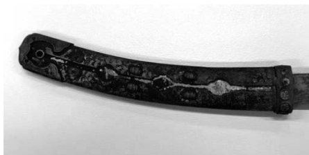
図1-1. 柄1(金属装)の外観

偏差解析の検証は、形状が近似する資料の中でもCTの測定がしづらい資料で効果が判定できれば様々な資料に転用できる可能性が高い。そこで、近似形状の宝刀の柄（金属装）2点を用いた（図1-1、図1-2）。いずれも国立アイヌ民族博物館の収蔵品である。