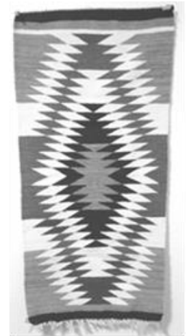
Fig. 4 1970年代以前に織られたサルティエーヨ・スタイルのラグ

強制転住期を生き抜いた織手たちは、交易所という新たな取引先のもとで、再び織物に情熱を注いだ。配給や交易所からジャーマンタウン糸が手に入るようになると、ほとんどの織手が手軽に使えるこの糸を使用した。ナバホ女性は強制転住後の自由を謳歌するように、高い技術と合成染料の多色糸を使用して、のびやかな図柄を織った。1880年代半ばには、サルティエーヨ織の影響が強い“アイダズラー（目眩し模様）”と呼ばれる複雑な図柄が、ジャーマンタウン糸で数多く織られて交易所に持ち込まれた (Fig.5) 19 。この時期を衣服や寝