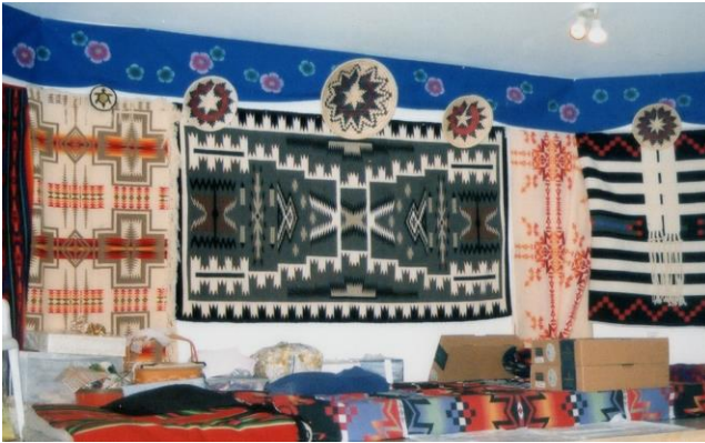
Fig. 10 ナバホの結婚式場内部 (2000 年天野撮影)