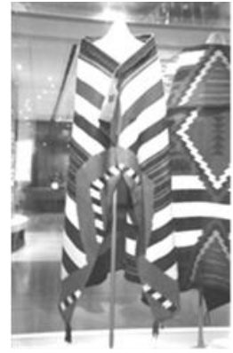
Fig. 3. チーフ・ブランケット アリゾナ州ハード博物館蔵