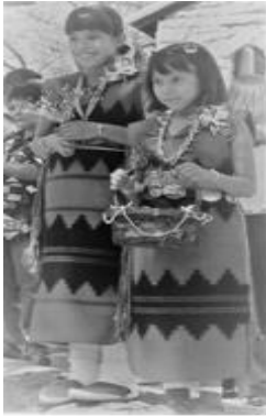
Fig. 1. ツーピース・ドレス (Figs. 1-2:2000 年天野撮影)