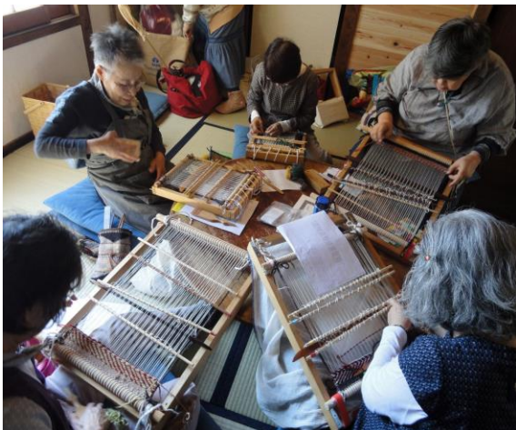
Fig. 7 グループで織る参加者

本事例ワークショップでは、ナバホ講師と受講者が4日間寝起きを共にし、一緒に温泉を楽しみ、土地の郷土料理を食べるなど、終始和やかな雰囲気での交流が行われた。ナバホ講師は、織技術からナバホの宗教観や神話、タブーに至るホリスティックな講義を行った。S氏は80歳という高齢にもかかわらず保留地から遥々来日し、精力的に織り指導をこなしていた。S氏による蜘蛛女の神話の語り、居留地での生活や幼いころの冒険などを聞くことは、受講者にとってワークショップを興味深いものにしていった。一方、ナバホ織手にとってもグローバルな展開は、経済活動だけではない。本事例のように海外の開催地に出向いて滞在することで、その土地の文化や織物、人々に触れる。S氏によれば、多様な人々や文化に触れることは、彼女自身の創作活動の糧になっているという。日本でのワークショップはナバホ講師と受講者双方にとって貴重な体験となった。