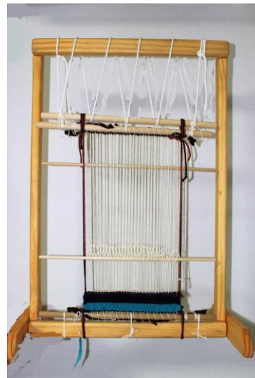
Fig. 8 筆者の織機(ナバホ職人製作、 天野撮影：2017年)