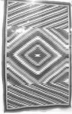
Fig.5 過渡期のアイダズラーで、ジャーマンタウン糸使用(ナバホ・ネイション博物館所蔵)

具などの実用的な織物から、次のラグへと変化する途上の過渡期と位置付ける (Wheat et al. 1977:37; 小谷 et al. 1985:15, 16, 74)。