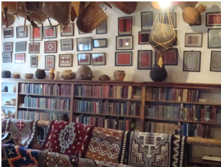
Fig. 11 ハブル交易所内部 National Historical Sight (2008 年天野撮影)