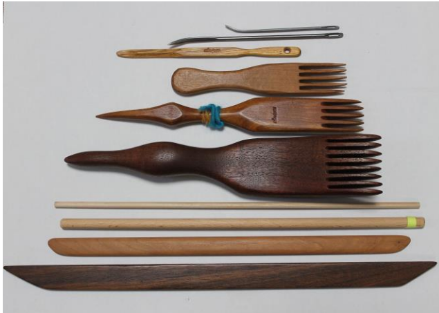
Fig. 9 織道具 (ナバホ職人制作、2017 年天野撮影)