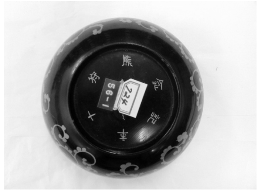
図版 4. 民族 0724_椀 B