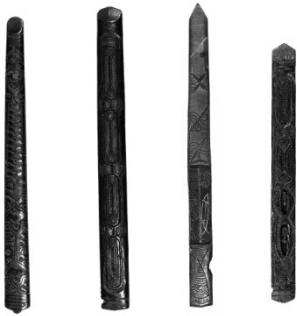
図版 3. 棒酒箸